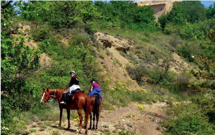
Montée d'Upaix (CDTE)