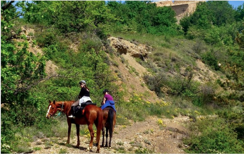
Montée d'Upaix (CDTE)