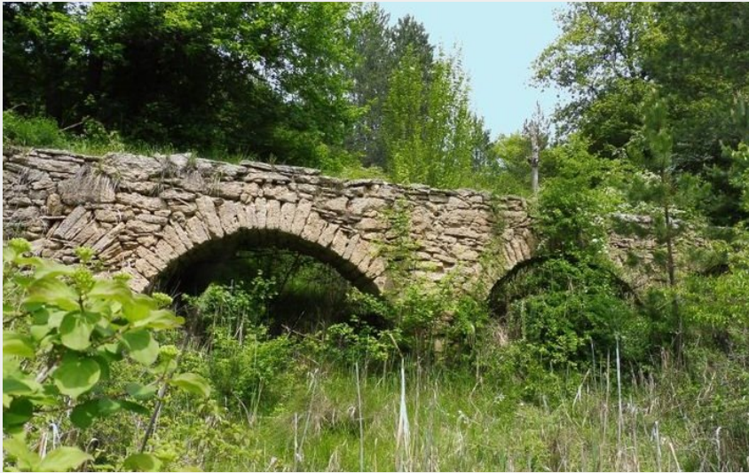
L'Aqueduc - CD Alpes de Haute Provence (RM, CD Alpes de Haute Provence)