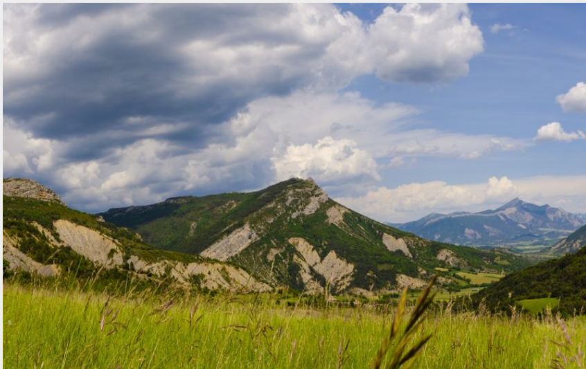
A proximité du Col de Carabès (CCSB)