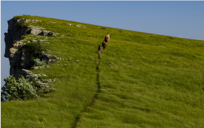
En direction du sommet de Chamouse (CCSB)