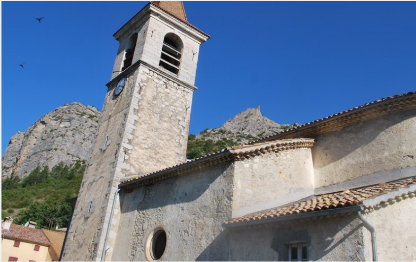
Le village d'Orpierre (CCSB)