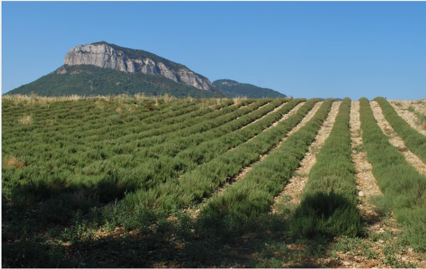
Le Mont Garde et les champs de lavande (CCSB)