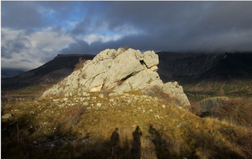
Ambiance orageuse autour de Savournon (CCSB)