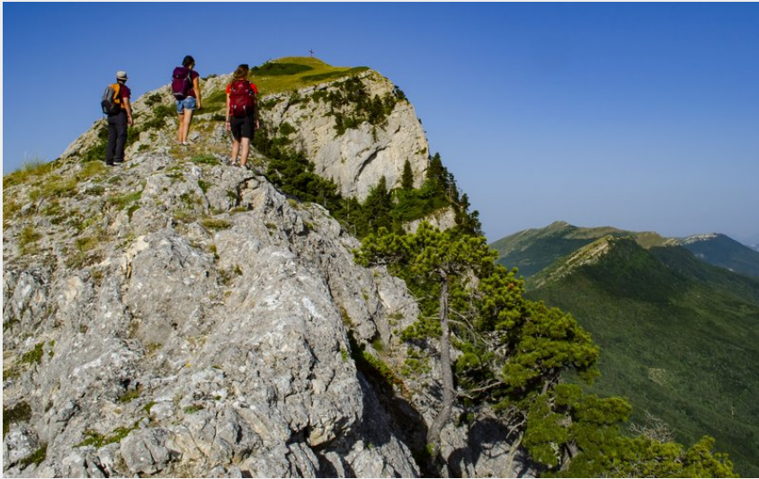
Un beau panorama à contempler (CCSB)