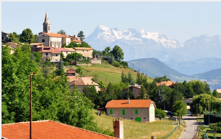
Panorama sur le massif des Ecrins au second plan (CCSB)