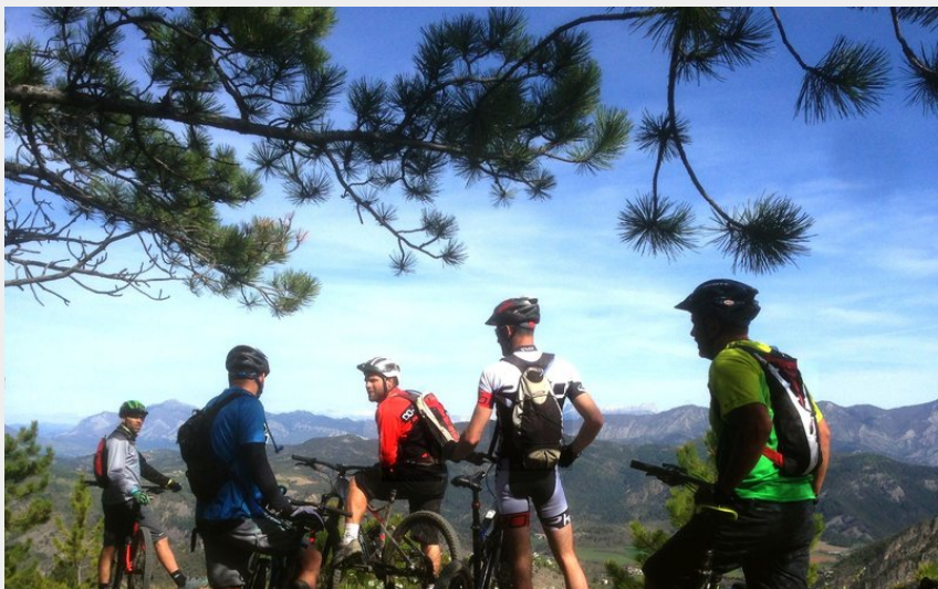
Vue panoramique (Office de Tourisme La Motte du Caire)