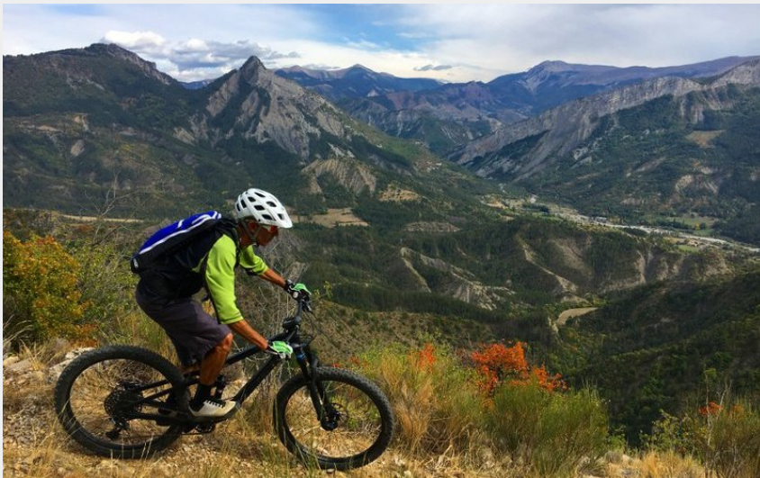
Chemin en balcon