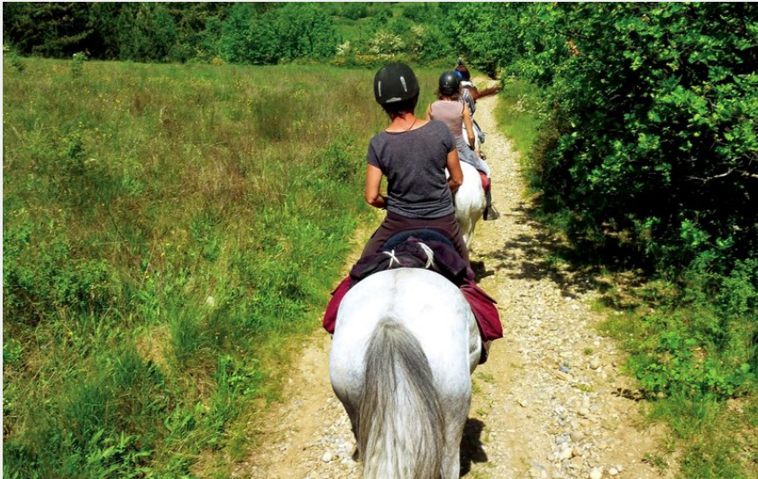
Autour de Ventavon (CDTE)