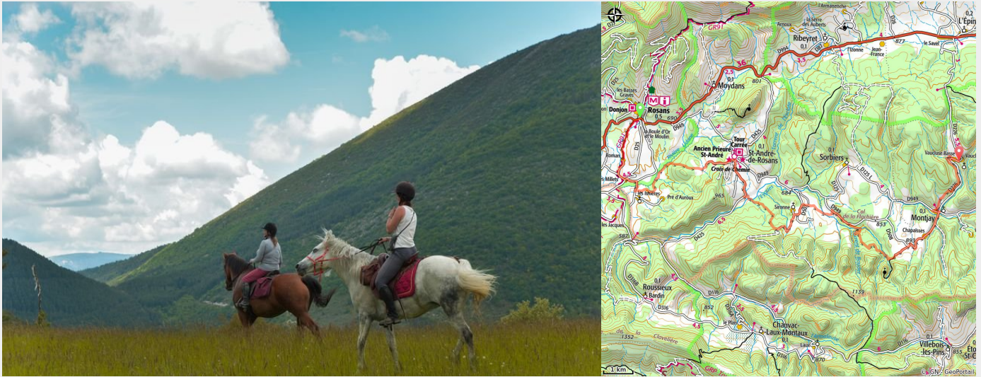
Paysages du Rosanais (CCSB)

Etape de 25 km qui part à la découverte du Rosanais. En chemin, le prieuré Clunisien de Saint André de Rosans invite dans l'art roman provençal avec de superbes frises sculptées et des mosaïques du XIIe siècle.