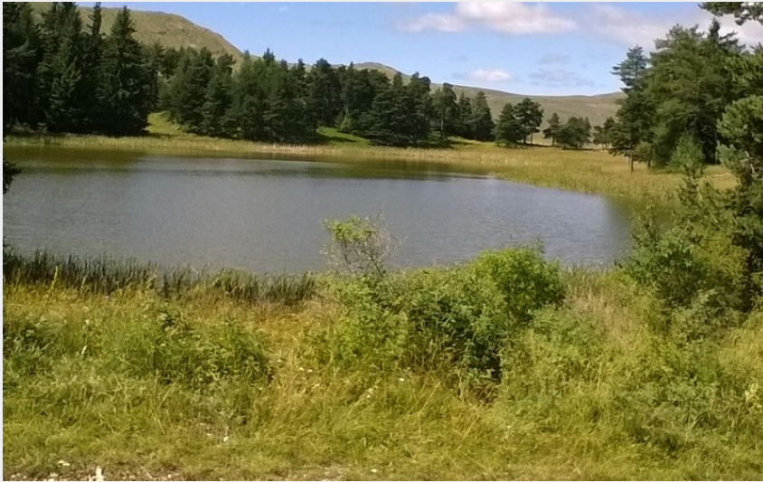
Lac des Monges (CCSB)