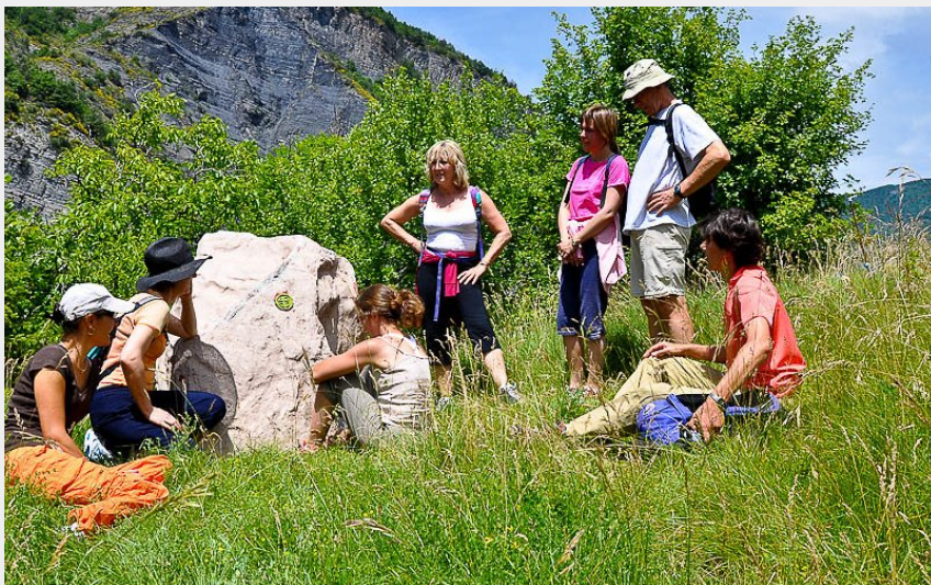
Le rocher qui parle