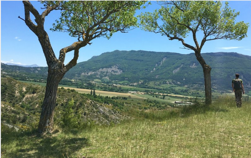
Sur les hauteurs de Savournon (CCSB)