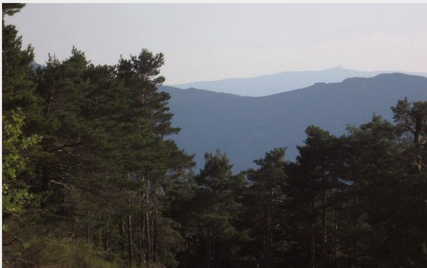
Panorama sur le Mont Ventoux au fond (CCSB)