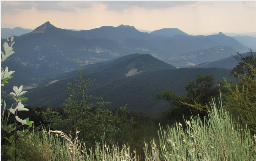
Jolie lueur sur les hauteurs du Duffre (CCSB)