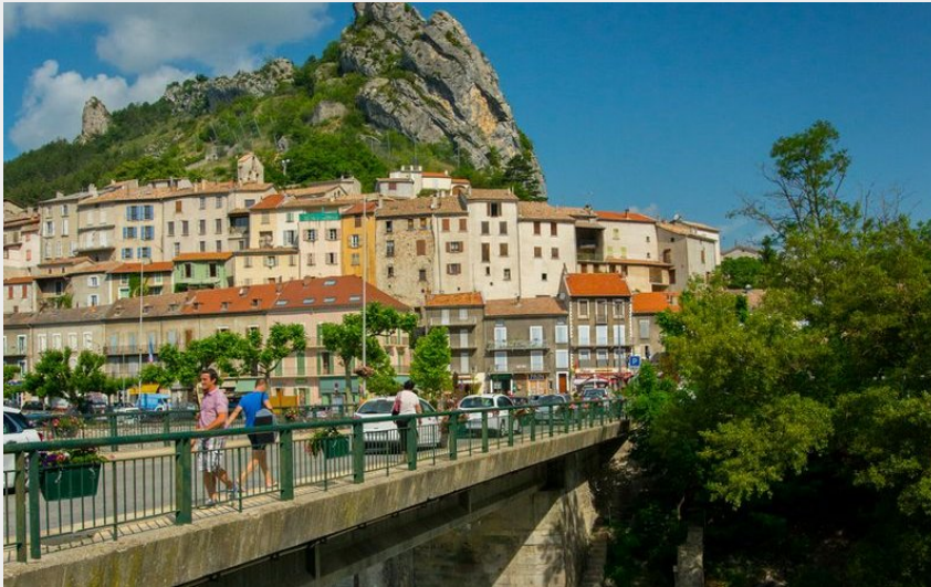
Vue sur le village de Serres (Espace Rando)