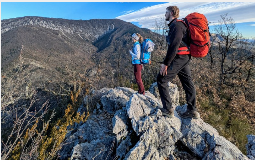
Panorama depuis la crête de Fontarache (CCSB)