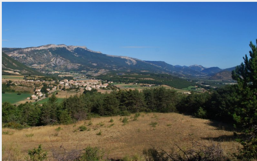
Panorama sur la Vallée du Buëch (CCSB)