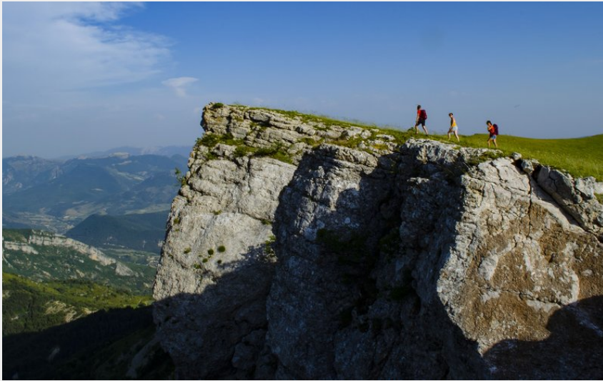
Magnifique portion sur crête (CCSB)