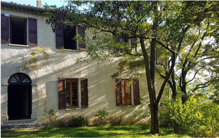
Appartement à l'étage de la bâtisse