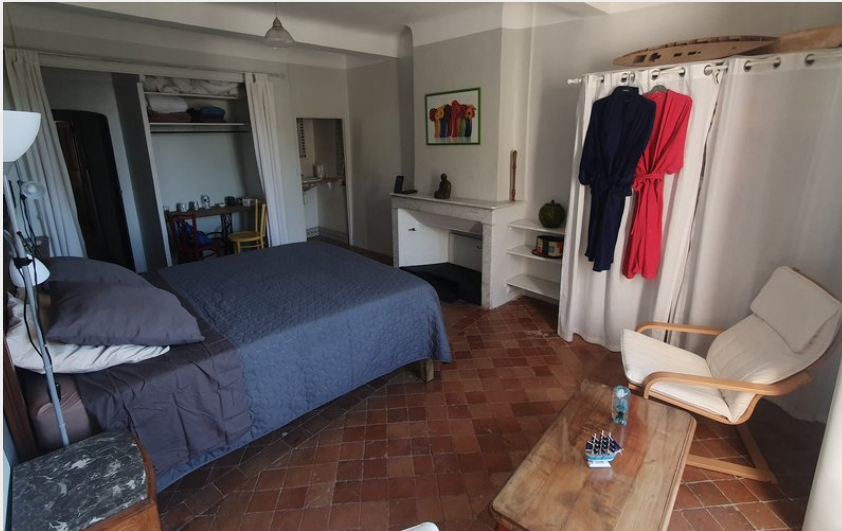
Vue d'ensemble grande chambre