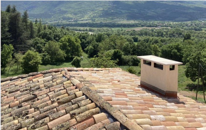
Crédit photo : Vue de la terrasse tropézienne (Domaine de Combe Beluze)