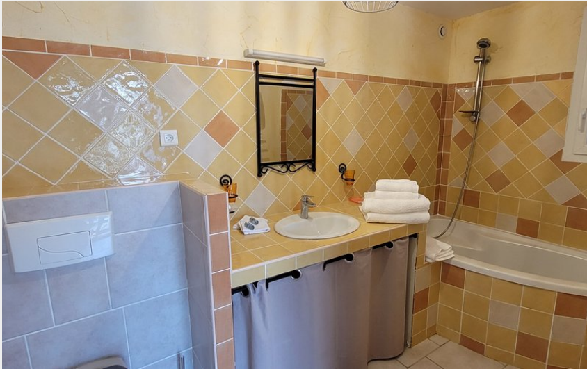
Crédit photo : Salle de bain chambre jaune et vert (Franck Le Nedic)