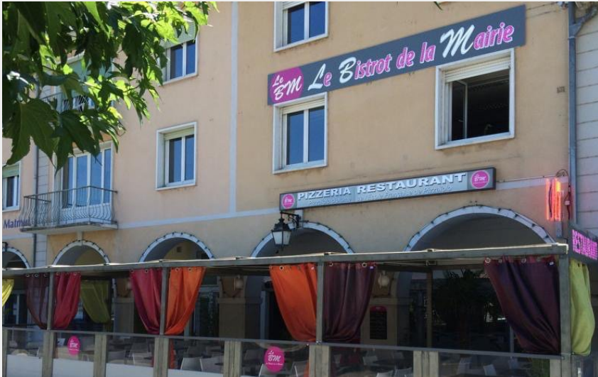
Crédit photo : Le Bistrot de la Mairie à Sisteron (Le Bistrot de la Mairie)