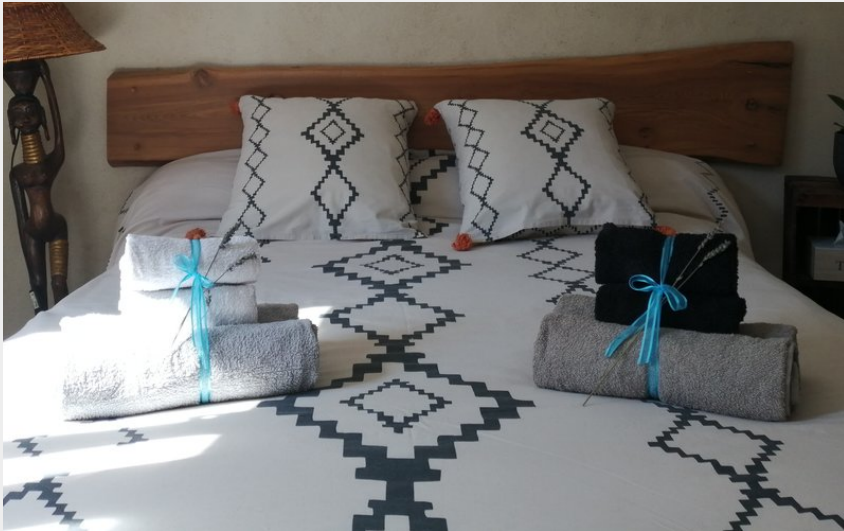
Crédit photo : La chambre du haut avec sa literie neuve et salle de bain privée (Le gîte de Marie)