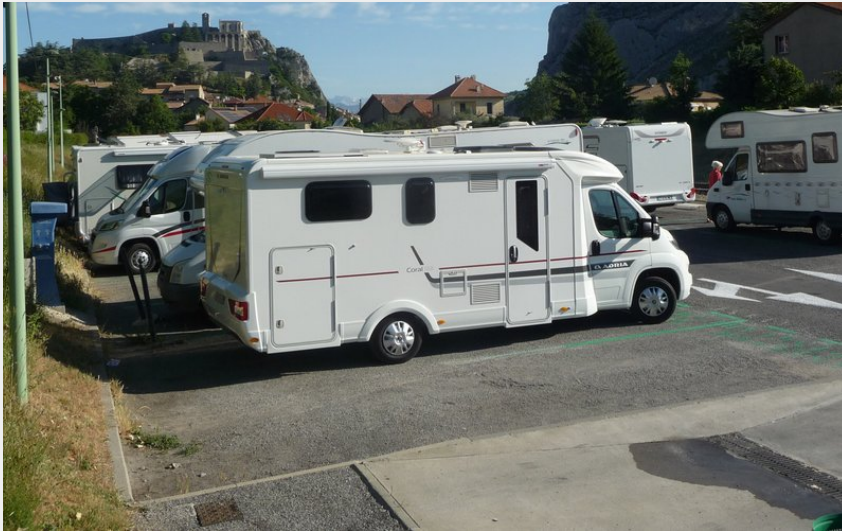
Crédit photo : A 5 minutes à pied du centre-ville (Office de Tourisme Sisteron Buëch)