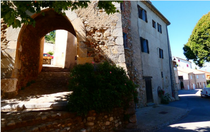
Crédit photo : La porte de ville et le château (Office de Tourisme Sisteron Buëch)