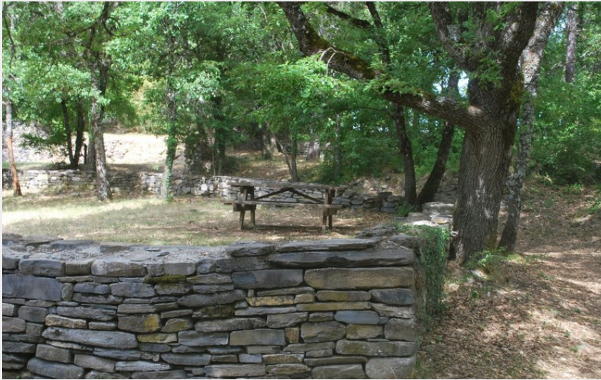
Crédit photo : Le Vieil Eyguians (Communauté de Communes Sisteronais Buëch)