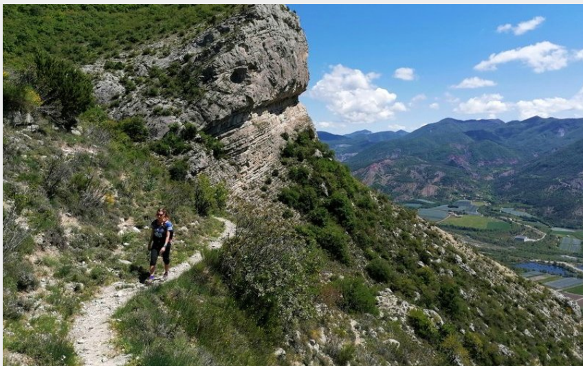
Crédit photo : Randonnée au dessus du village, vers le pic de Crigne (Communauté de Communes Sisteronais Buëch)