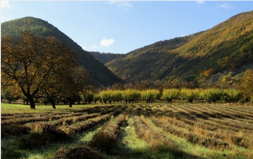
Crédit photo : La paisible Vallée de l'Oule (Communauté de Communes Sisteronais Buëch)