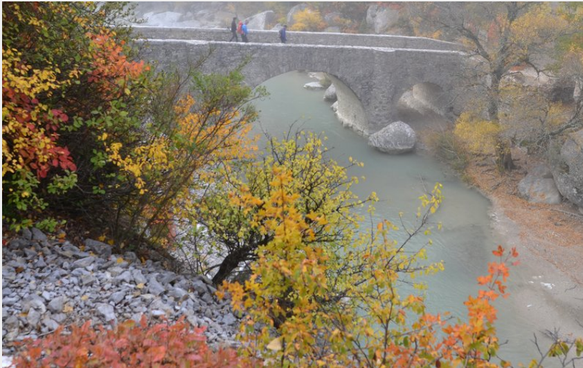
Crédit photo : Les Gorges de la Méouge à l'automne (Mairie de Val Buëch Méouge)