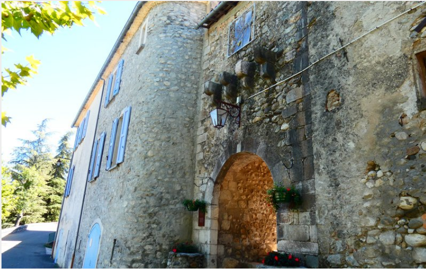
La Porte Charretière