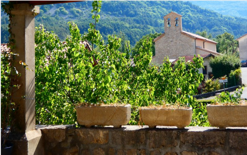
L'église depuis un des lavoirs du village