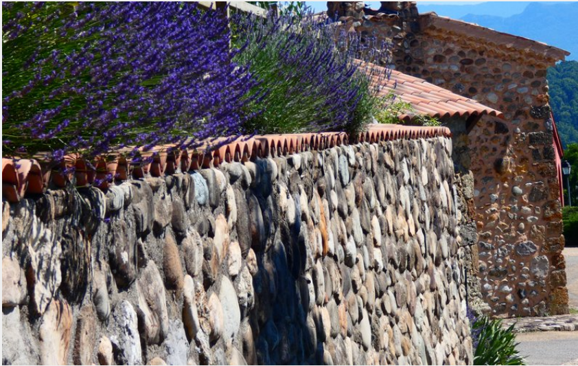
Crédit photo : La Chapelle des Pénitents à Upaix (Office de Tourisme Sisteron Buëch)