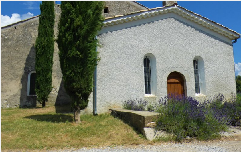
Chapelle Saint Domin