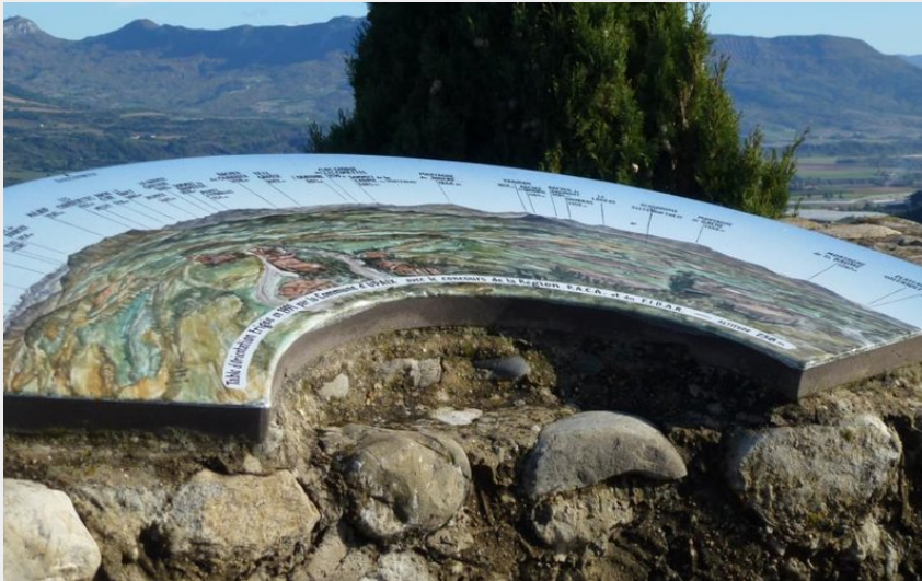
Crédit photo : Table d'orientation de la Tour d'Upaix (Office de Tourisme Sisteron Buëch)