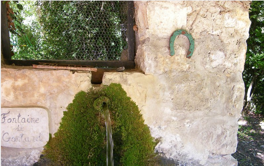
Fontaine de Gontard