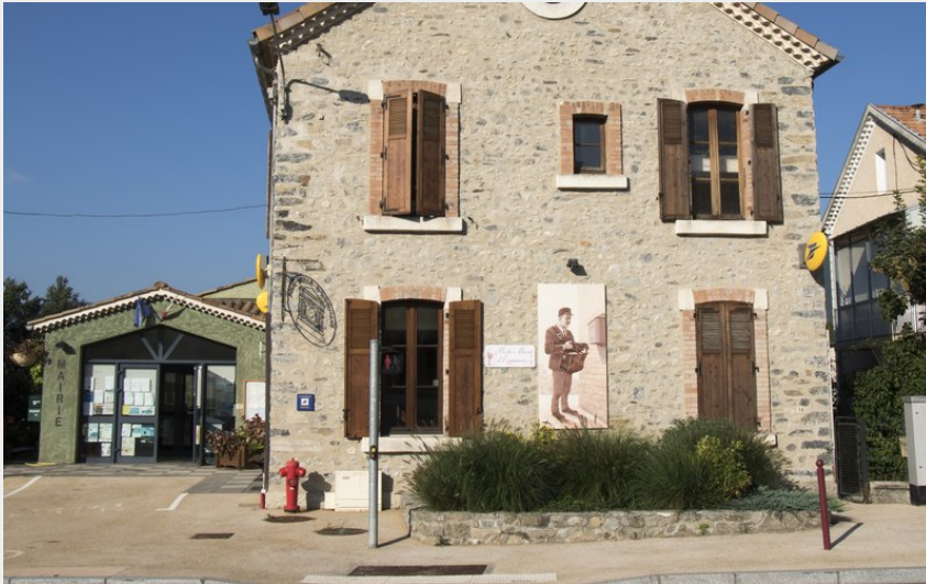
Crédit photo : La Poste Musée d'Eyguians à Garde-Colombe (Patrick Domeyne)