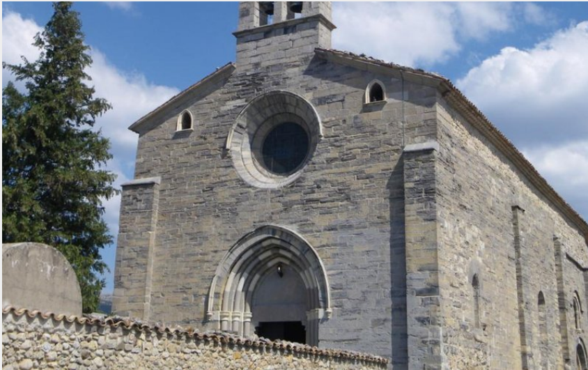
Crédit photo : Eglise de Lagrand (Office de Tourisme Sisteron Buëch)