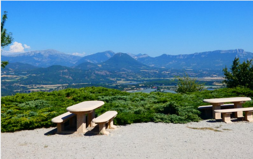
Crédit photo : Aire de pique nique de la Tour d'Upaix (Office de Tourisme Sisteron Buëch)