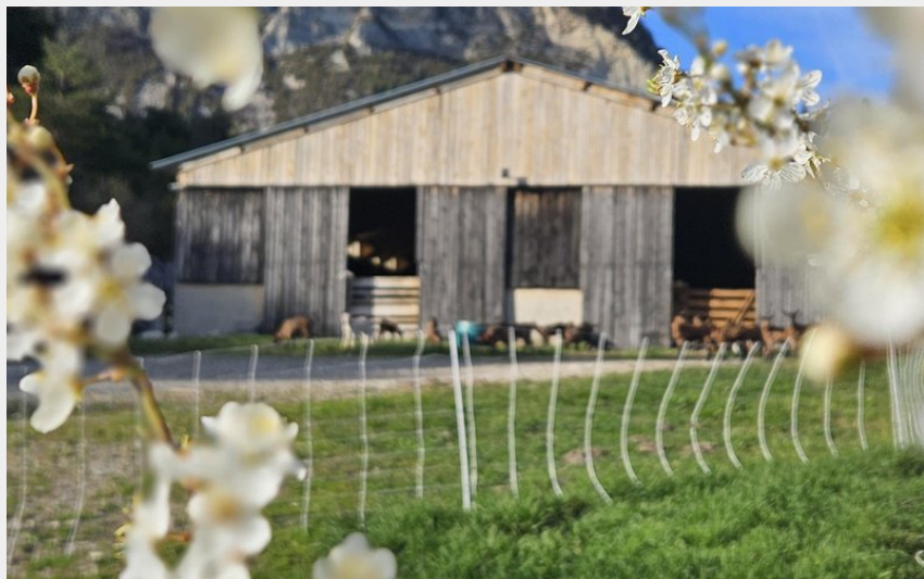
La ferme au printemps 2025