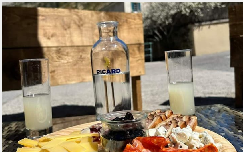
Crédit photo : Terrasse avec vue sur les falaises d'Orpierre (Bar restaurant Le QZ)