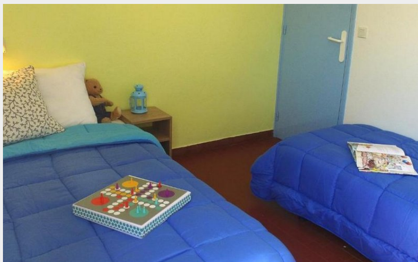
Crédit photo : Chambre 2 lits (VVF Club Essentiel Le Plateau Provençal)