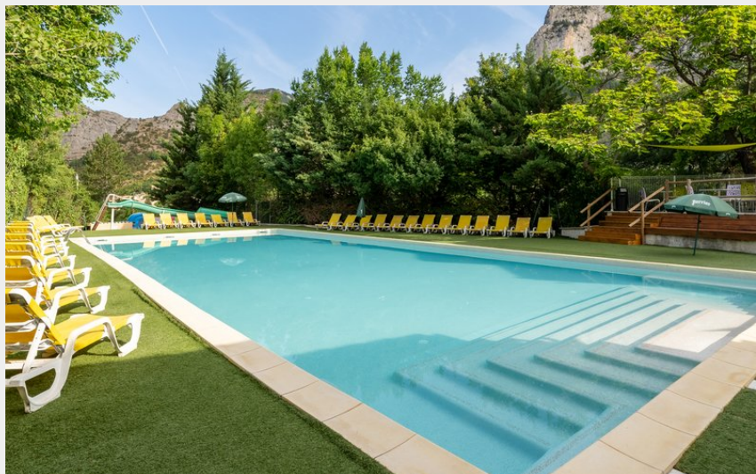
Crédit photo : Camping les Princes d'Orange à Orpierre (Camping les Princes d'Orange)