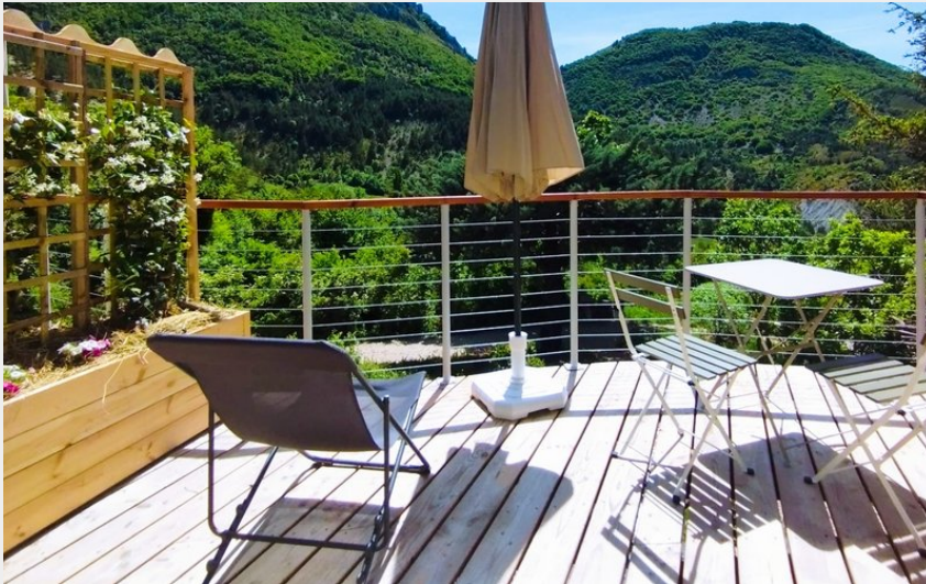
Crédit photo : Farniente sur la terrasse (Gîte des chalets perchés)