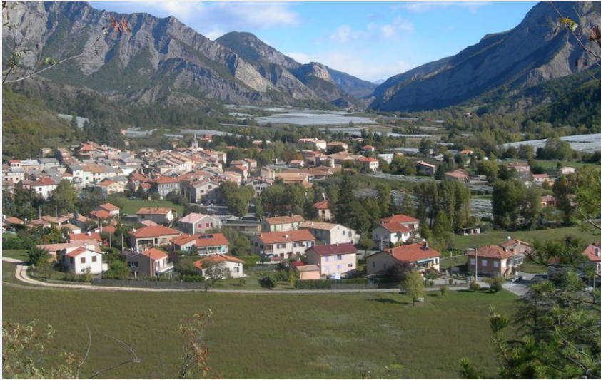
Vue du village de La-Motte-du-Caire